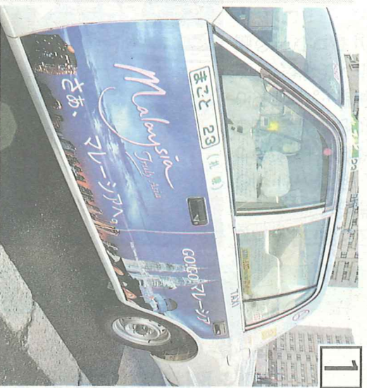
1 ほとと交通が8月から掲載を始めたテレビの広告人気ゲームバイクオアシスの広告を載せた長栄交通のタクシー