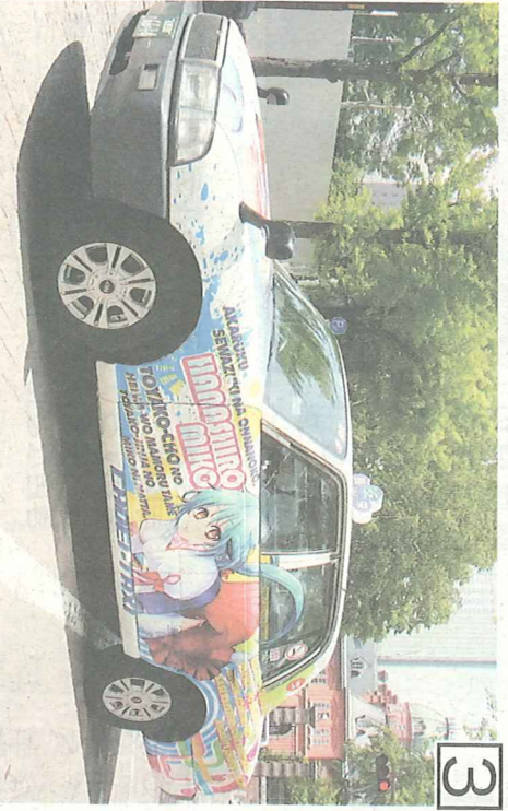
3 札幌市の場合、札幌市屋外広告物条例で、広告の大きさや張る位置を指定。車体全体を覆うツインクックシーの場合、札幌市に事

取らない。車体広告はドライバーが貼るのだが、作業はすべて社員が行う。「予約は、車体指名で予約してくれる。1日の売り上げをみても、普通の車より高価格帯の車と比べると、ドライバーの作業が減少する。ドライバーが本気でできるか、こんなことが言える。次々と新たなサービスも出てきた。今年も、次々と新たなサービスを走らせた。消費者に、この会社はタクシーを走らせた。1099年、屋外広告物法の改正に伴い、都道府県や政令市がそれぞれ屋外広告物条例を定め、管理している。